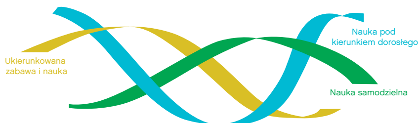
Rys. 1 — Zintegrowane podejścia do nauczania i uczenia się

Nauka oparta na zabawie oraz podejścia, takie jak nauka oparta na dociekaniach, nauka aktywna i nauka przez doświadczenia, zostały opracowane na podstawie tych samych teorii nauczania. Ich kluczowym założeniem jest współpraca uczniów i nauczycieli w formie partnerstwa mającego na celu wspólne tworzenie wiedzy. W przypadku wspomnianych systemów środowiska nauczania są świadomie projektowane w taki sposób, aby maksymalnie sprzyjać kreatywności, interakcji społecznej, eksperymentowaniu i radości z nauki.