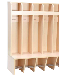
Szatnia Porządkuś w tonacji klonu

Ta sama płyta klonowa występuje w szatni Porządkuś. Odcień tej płyty klonowej jest wizualnie zbliżony do stosowanej w innych kolekcjach płyty w tonacji brzozy, natomiast nieco inny od drugiej płyty klonowej używanej w kolekcjach: Expo, Sanlandia i Inlandia.